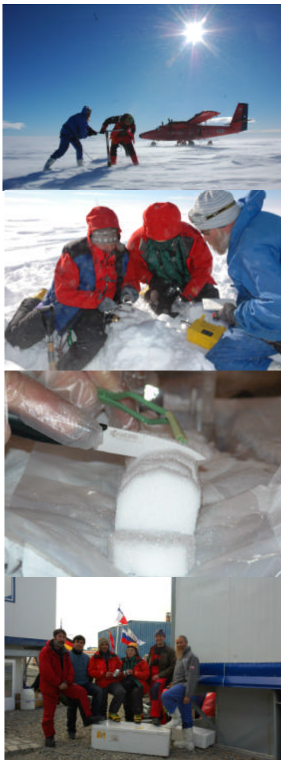
Fig. 2. Perforación de un testigo somero en el Plateau Detroit, determinación de densidad in situ , procesamiento de muestras, y grupo de investigadores involucrados.